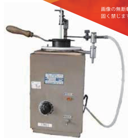
クリーブランド 開放式引火点測定器