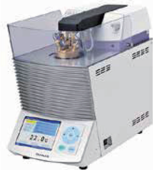
タグ密閉式 引火点測定器

危険物確認試験は物質の性状により、試験方法が異なるため、試験内容が複雑ですが、詳細につきましては、当社HPに添付されている危険物確認試験フローシートを参照して下さい。