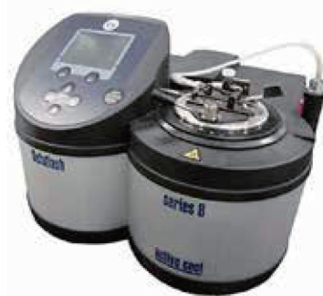
セタ密閉式 引火点測定器